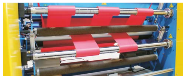
Zum Leistungsumfang gehört auch die individuelle Konfektion wie beispielsweise der Zuschchnitt von Klebefolien.

Die drei Tochterfirmen Plica AG (Industrie- und Elektrogrosshandel), Tegum AG (Bau und Gewerbe) und Casaton AG (Klebetechnik, Plattenleger- und Baumaterialien) tragen das operative Geschäft. Mit den zentralen Bereichen Logistik, Administration, Qualitätsmanagement und Informatik schöpft die Gruppe interne Synergien und ermöglicht es ihren Tochterfirmen, sich voll auf Beschaffung, Marketing und Verkauf zu