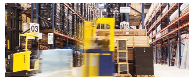
Tausende von Produkten für Industrie, Gewerbe und Bausektor werden kommissioniert und täglich ausgeliefert.